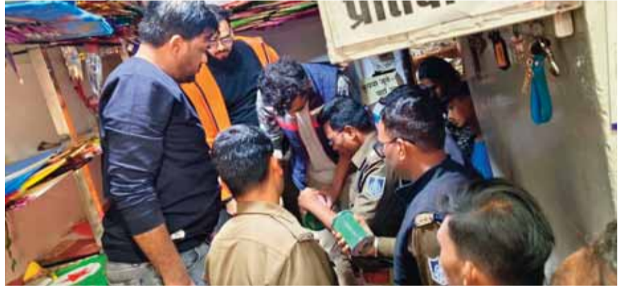
हरिभूमि न्यूज कटनी